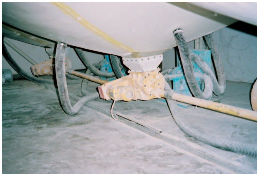
Abb. 3: Beispiele für „schlechte“ Reinhaltung des Siloraums [18]: Zone 22