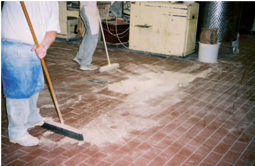
Abb. 2: Durch Feuchtigkeit oder Fett sind diese Staubschichten nicht aufwirbelbar und damit kann auch keine explosionsfähige Atmosphäre entstehen, d.h. keine Zone .