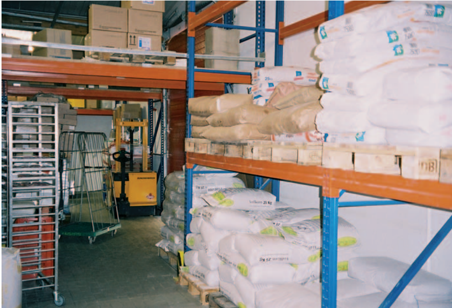
Abb. 4: Beispiele für „gute“ Reinhaltung des Siloraums [18]: keine Zone