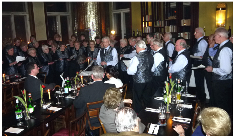
Die Sängergesellschaft der Bäcker-Innung Nürnberg