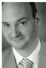
Martin Rössler Rechtsanwalt auch Fachanwalt für Arbeit-, Bau- und Architektenrecht

Die Befristungsvereinbarung muß vor Arbeitsantritt des Arbeitnehmers von beiden Parteien unterzeichnet werden. Mündliche Abreden sind gefährlich und führen i. d. R. zur Unwirksamkeit der Befristung. Wichtig ist immer, daß spätestens am ersten Arbeitstag vor Arbeitsbeginn die Unterschrift erfolgt. Der neue Arbeitnehmer darf keinesfalls zu arbeiten anfangen, ohne vorher die Befristungsabrede unterzeichnet zu haben!